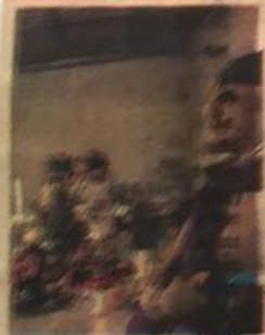
Fatídico terremoto dejó luto a hogares istmeños