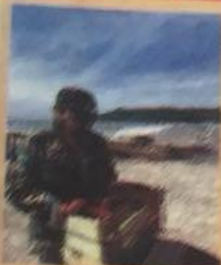
Molestia de restaurantes por la irresponsabilidad de Pemex