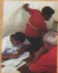
Recibirán comerciantes apoyo por la afectación por sismos